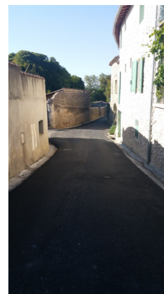
Rue du Puits neuf

Les subventions allouées par l'Etat, le Conseil général et le Conseil régional sont assujetties à la stricte observation du contenu des travaux à exécuter arrêtés dans un cahier des charges établi fin 2014. Toutes modifications sont susceptibles d'entraîner la remise en cause de l'attribution de ces subventions. Nous sommes contraints de nous en tenir à ce qui a été arrêté par les services préfectoraux ce qui ne nous empêche pas de tenir le plus grand compte des observations et propositions de tous. Nous y répondons volontiers dans la mesure où elle n'engagent pas de dépenses supplémentaires pour la commune et ne modifient pas le « contrat » passé avec nos financeurs. Merci pour votre compréhension. (Nicole Raymond)